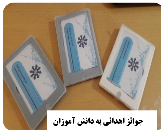
جوایز اهدائی به دانش آموزان